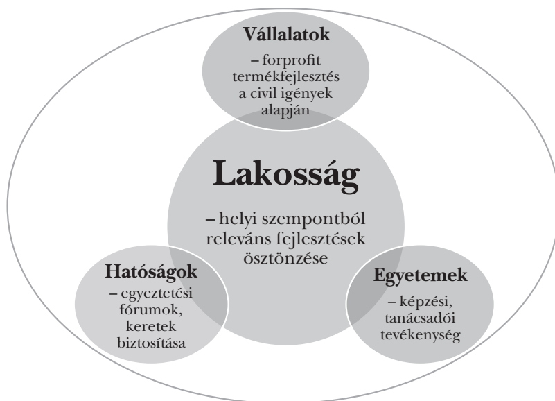
2. ábra: A helyi gazdaságfejlesztés civil központú Quadruple Helix-modellje