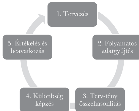
2. ábra: A kontrolling szabályozói kör

A kontrolling funkcionális elemei a szerzők megfogalmazásában a tervezés, terv – tény eltéréselemzés és a hozzá tartozó információkezelés. A vezetési szemlélet összefüggéseit leginkább az 2. ábra érzékelteti.